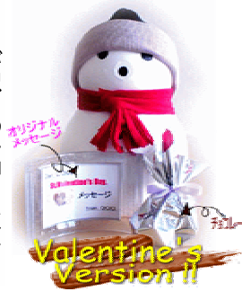
Valentine's Version II

義理チョコというのは本命チョコのカモフラージュとして始まったと、製菓企業の販売戦略に世の女性が、まんまと乗せられたとも言われますが、多くの男性が「義理」と判っていても喜んでいるのは事実です。